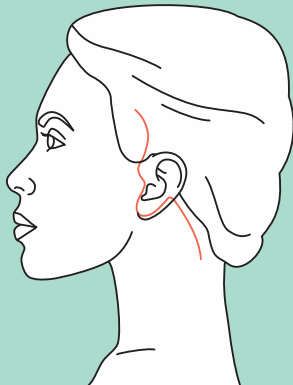
Narbenverlauf nach dem Facelift

Jede Operation bringt Risiken mit sich. Die Risiken eines Facelifts können aber minimiert werden, wenn die Operation von einem qualifizierten Plastischen Chirurgen mit genügend Erfahrung vorgenommen wird. Trotz größter Sorgfalt können aber, wie bei jedem chirurgischen Eingriff, während oder nach der Operation vereinzelt Komplikationen auftreten.