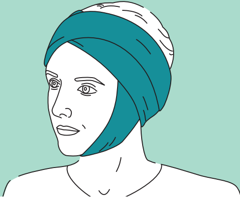
Kopfverband nach dem Facelift